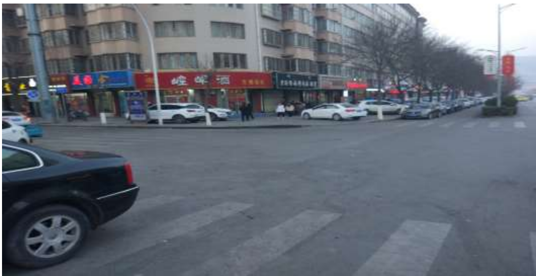
路面恢复（柳树巷东口至西寺街西口）