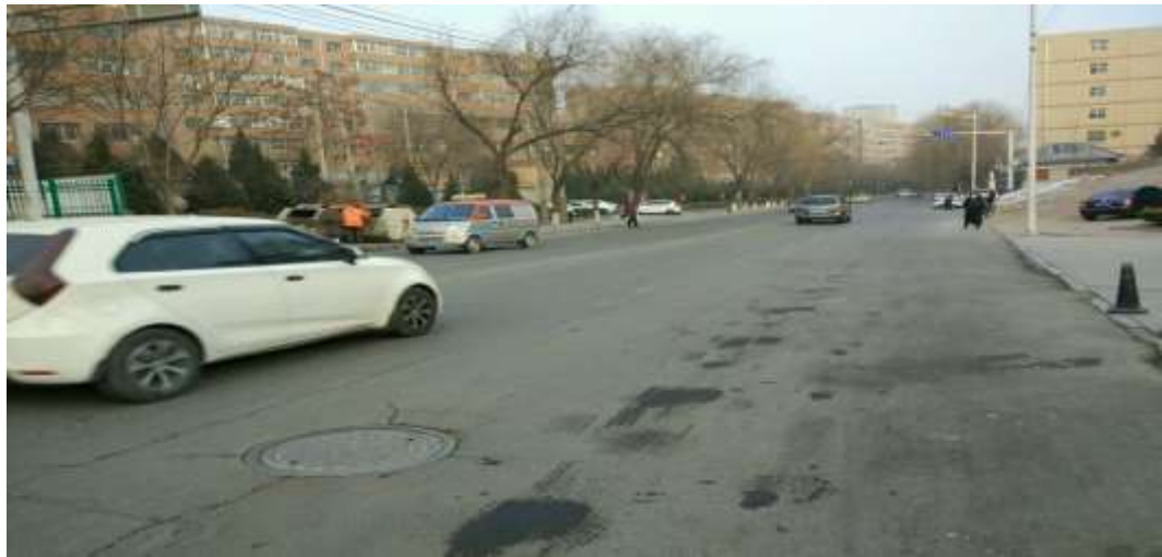
路面恢复（风景嘉苑门口）