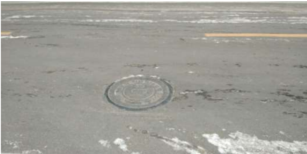
路面恢复（西站对面）