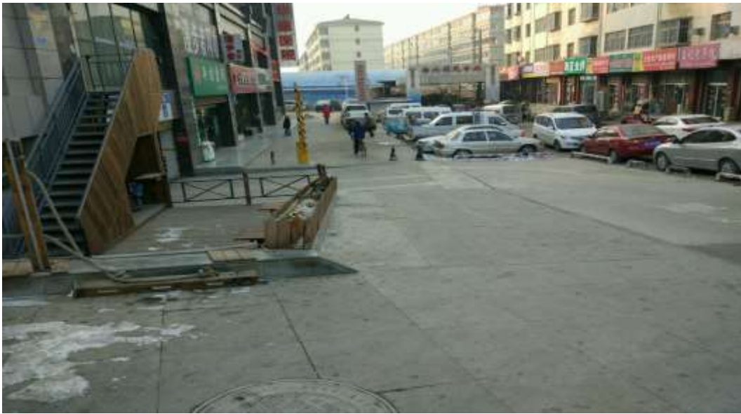
路面恢复（原八一宾馆门口）