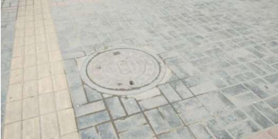
路面恢复（南环路至市林业局门口）