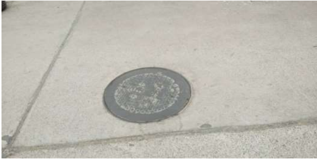
路面恢复（十中西侧天门）