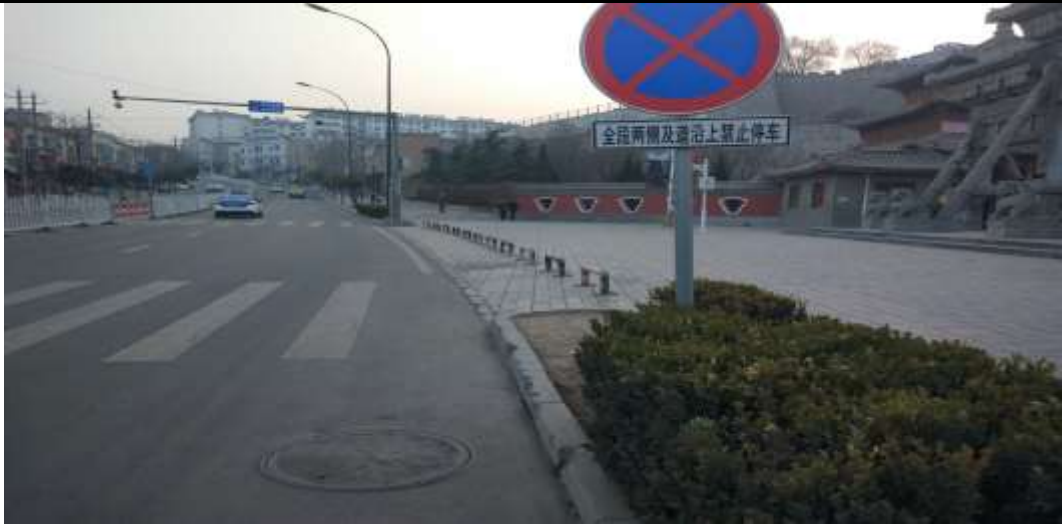
路面恢复（柳湖书院门口）