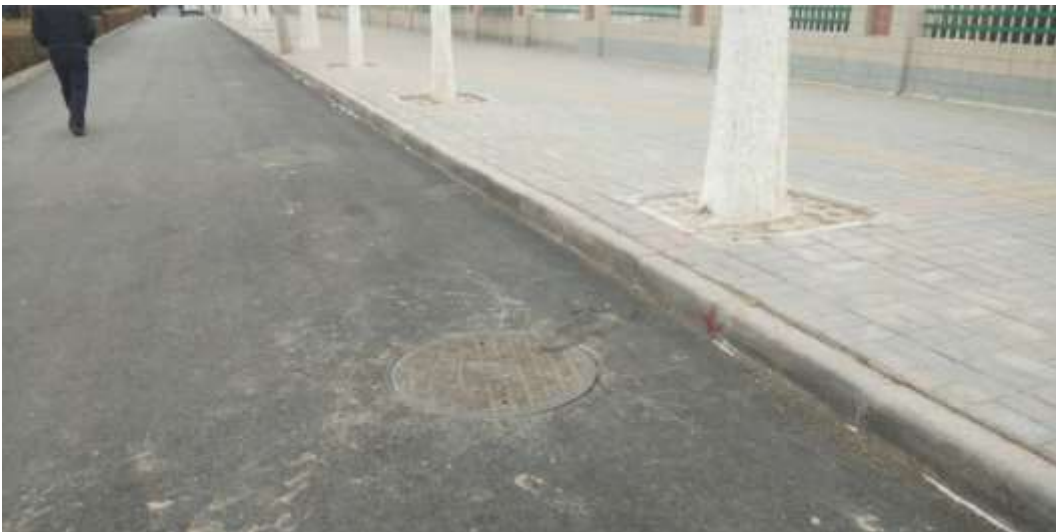
路面恢复（十中东侧天门）