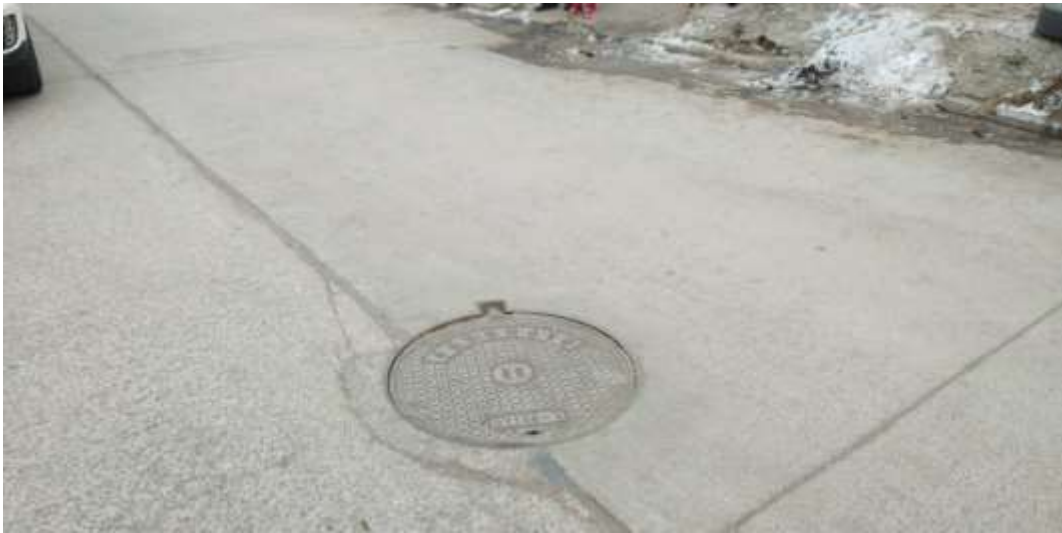
路面恢复（北大寺门口）