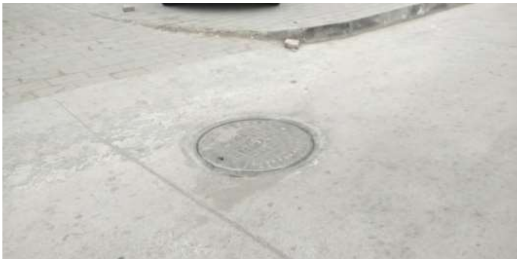
路面恢复（南门十字坡头至南环路）