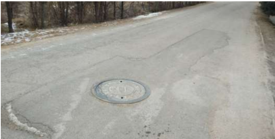
路面恢复（天门源坡头）